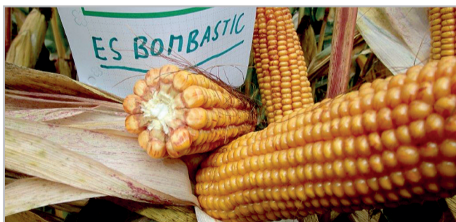
ES Bombastic – hybrid s excelentním výnosem. Jeho velké a dobře opylené palice s typem zrna mezityp až zub