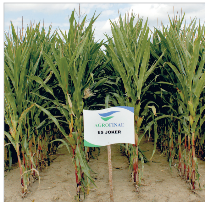
ES Joker – univerzální hybrid na siláž i zrno

Zemědělcům nejen na Vysočině, ale v rámci celé České republiky nabízíme výjimečné hybridy kukuřice, řepky a dalších plodin, které jim poskytují vysoký výnos, výbornou